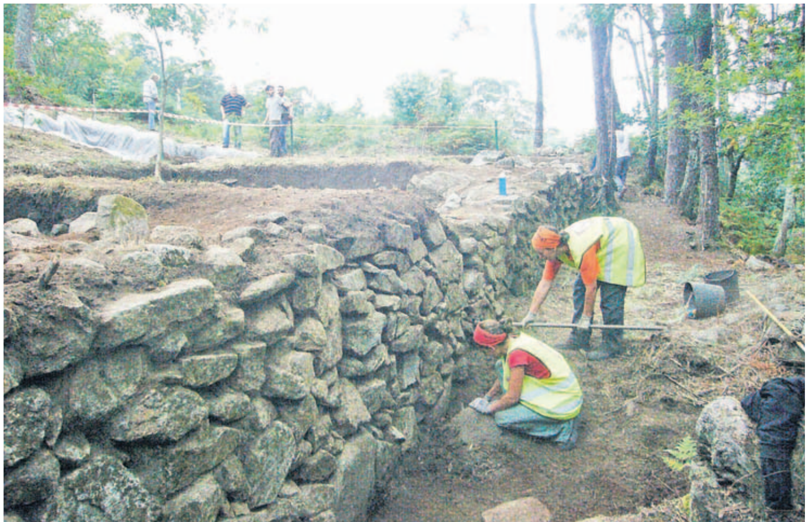
Detalle dos traballos na muralla exterior do castro das Croas.

Destaca unha robusta muralla ou parapeto de 14 metros de lonxitude, 1,5 m de altura conservada e ca- se 2 m de espesor que de- fende o castro polo E, a par- te que mira ao val do río To- meza, onde se sitúan outros dous recintos defensivos. As súas dúas caras vistas fo- ron levantadas con apare- llo ciclópeo alternado con cachotería.